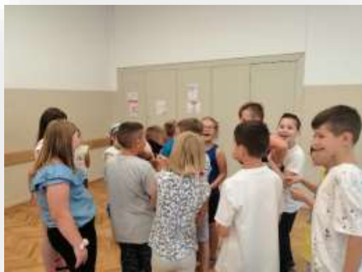
Između dvije vatre