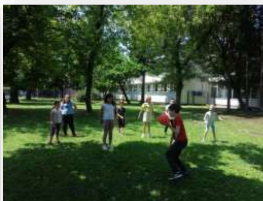
Čvorak ili Slijepi miš